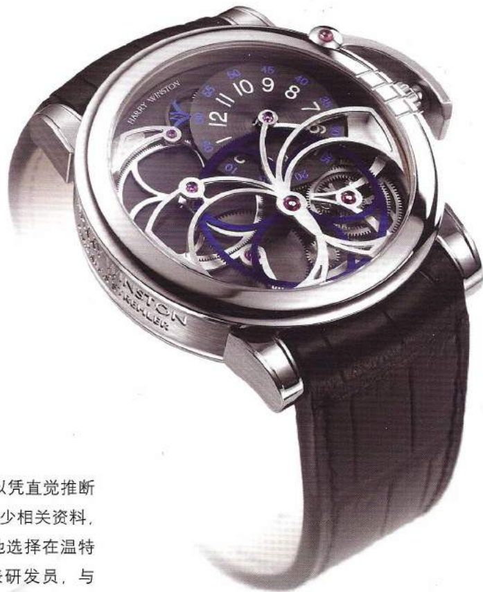
Harry Winston Opus7